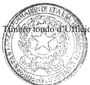
Timbro tondo d'Ufficio