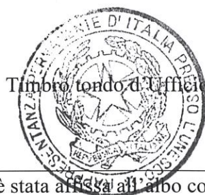
Timbro tondo d'Ufficio

Si dichiara che la presente graduatoria è stata affissa all'albo consolare e pubblicata nel sito della Rappresentanza Permanente presso l'UNESCO _____